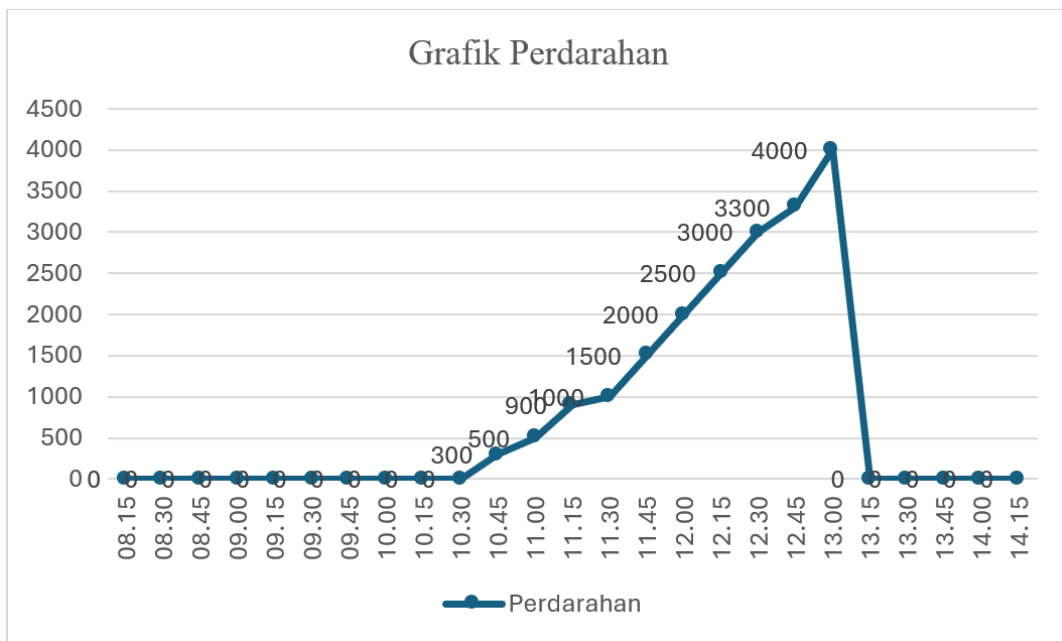
Gambar 2. Grafik perdarahan

setiap 15–30 menit untuk memantau kondisi hemodinamik pasien dalam menghadapi perdarahan masif. Pada awal operasi, nilai SpO 2 tetap stabil di kisaran 98–100%, menunjukkan oksigenasi yang adekuat. Laju pernapasan (RR) pasien berada dalam rentang 14–18 kali per menit, yang masih dalam batas normal. Sementara itu, denyut jantung (HR) awalnya berkisar antara 98–102 bpm, menunjukkan kondisi hemodinamik yang relatif stabil. Namun, seiring dengan meningkatnya volume